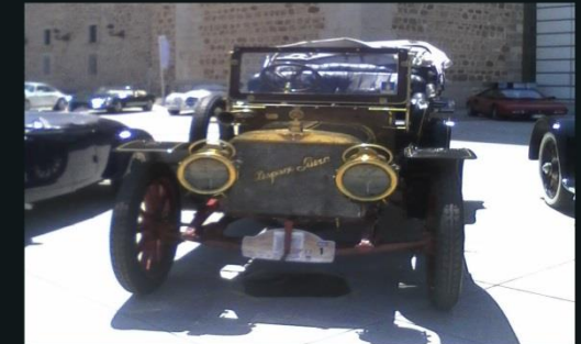
2015 HISPANO SUIZA M-1