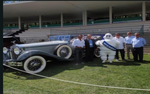
2014 ISOTTA FRANCHINI 4