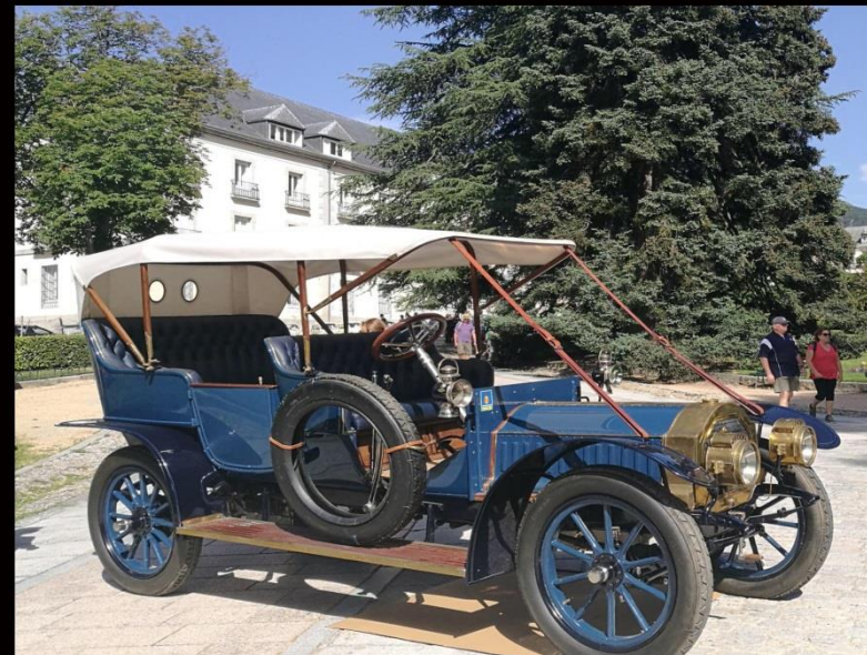
2017 HISPANO SUIZA H6