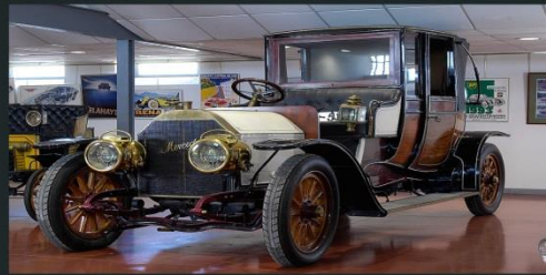
2013 MERCEDES SIMPLEX 1.902