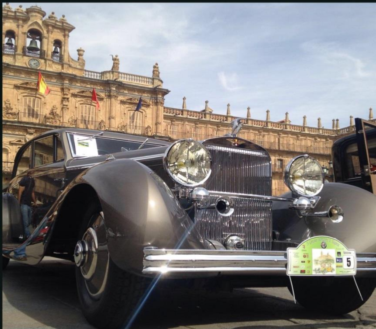
2016 HISPANO SUIZA J25