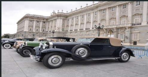
2012 HISPANO SUIZA HB6