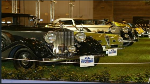
2002 ROLLS ROYCE