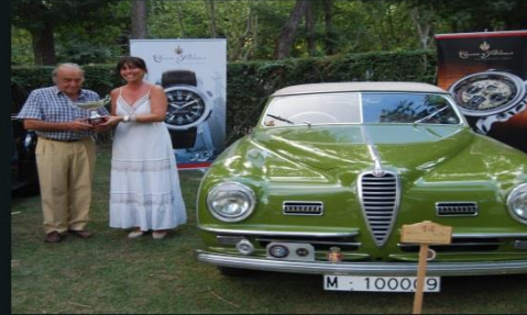
2010 ALFA ROMEO FLECHA DE ORO