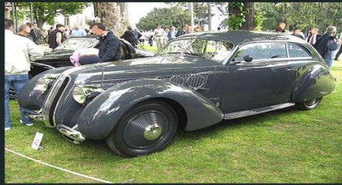
2009 ALFA ROMEO Pescara